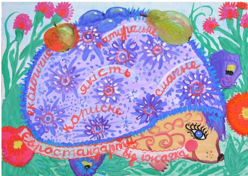
Заїченко Надія, 9 років, м. Чигирин “Євростандарти від їжачка”