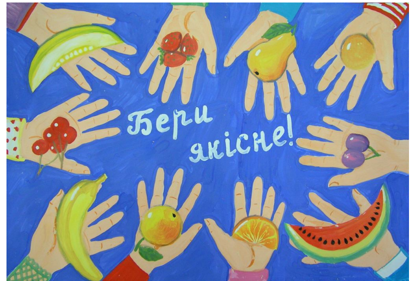
Бойко Софія, 8 років, м. Тальне “Бери якісне!”