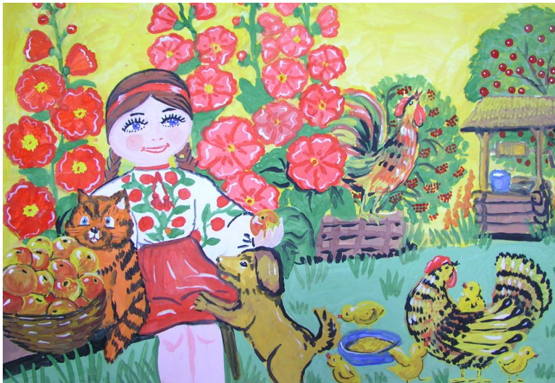
Матковська Ольга, 10 років, м. Тальне “Квіти, овочі і фрукти - У нас здорові всі продукти!”