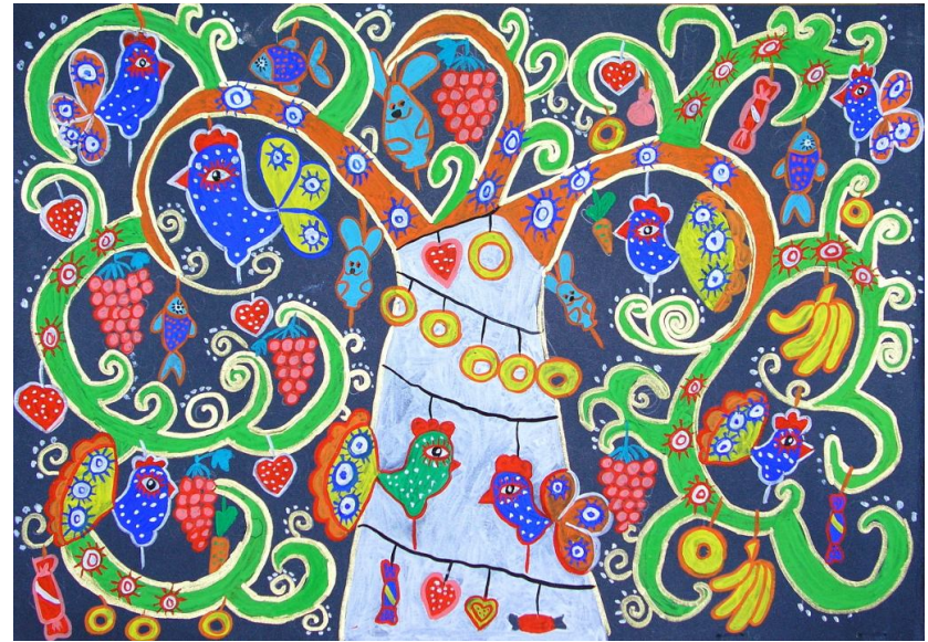
Аксентьєва Софія, 8 років, м. Черкаси “Солоденьке дерево”

Щороку Черкащину на виставці представляли цікаві роботи юних художників. Не є виключенням і цей рік. На розгляд Головного конкурсного журі для участі у загальнодержавному рівні від області надано 9 творчих робіт.